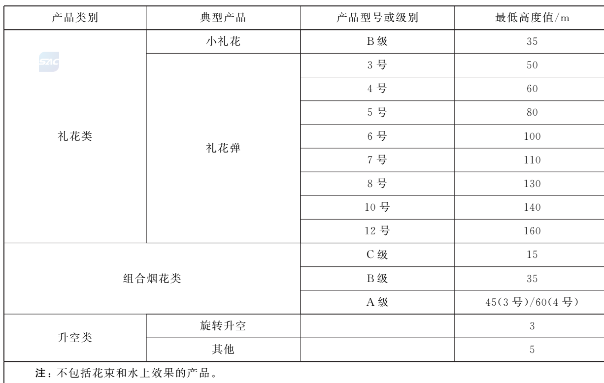
表 4 各类升空产品效果出现的最低高度值

5.7.3 发射升空产品的发射偏斜角应 \leq 22.5^\circ , 造型组合烟花和旋转升空烟花的发射偏斜角应 \leq 45^\circ (仅限专业燃放类)。