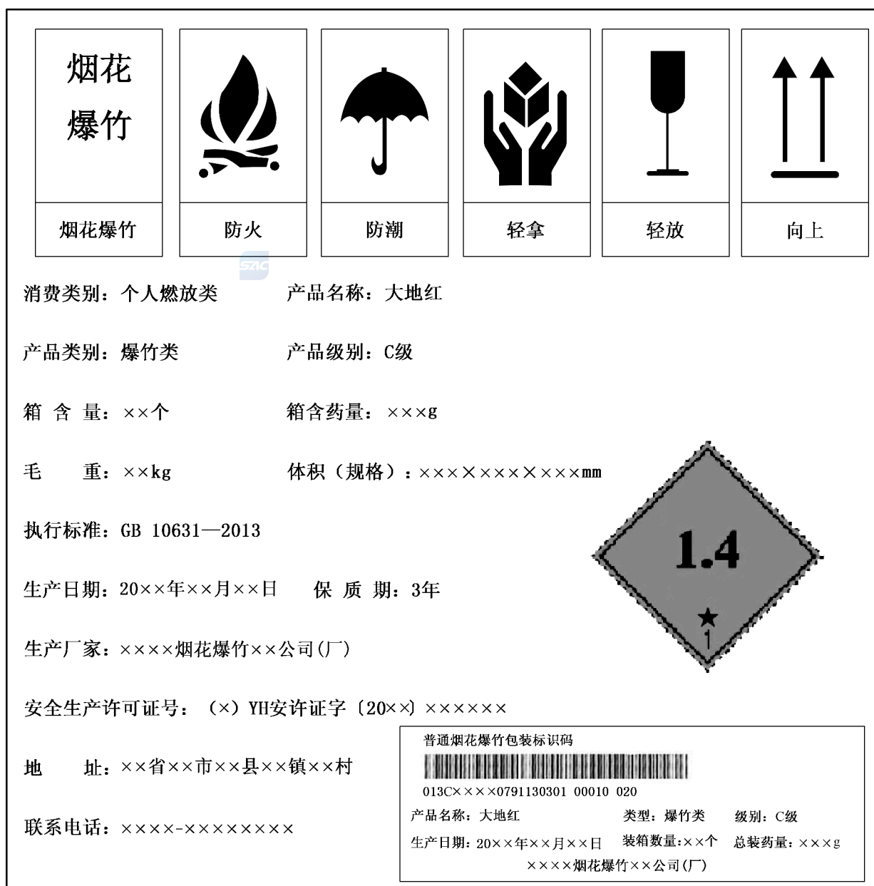
图 B.3 烟花爆竹运输包装标志内容示例